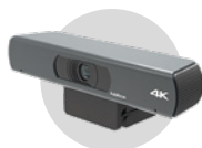
Caméra 4K 120° avec microphone intégré CAM-10