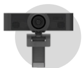
Caméra Full HD 120° avec microphone intégré CAM-05