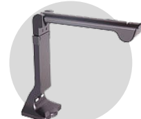
Visualiseur A4/A3 VS02