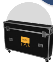
Flight case FC01