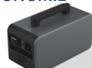
Module autonome PPS2000