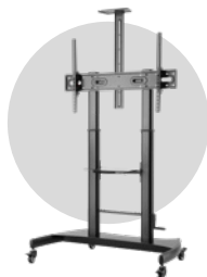
Stand mobile adjustable ST06