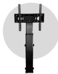
Colonne motorisée ST11