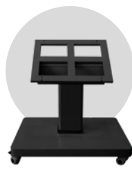
Stand multi angle motorisé ST12