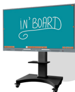
Tableau blanc dictatorial