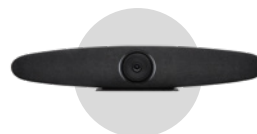
Caméra barre de son 4K tracking avec microphone intégré CAM-30