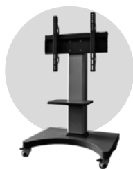
Stand mobile motorisé ST10