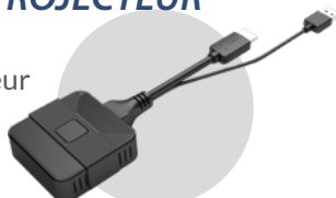
Dongle transmetteur Plug and play TRS-05