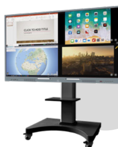
Encore plus de puissance pour votre fonction vidéo projecteur