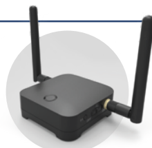
Kit de projection sans fil TR-02